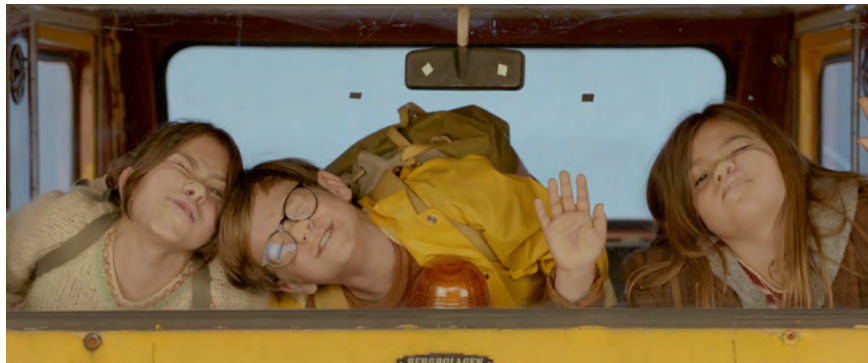
Biuro Detektywistyczne Lassego i Mai. Rabuś z pociągu