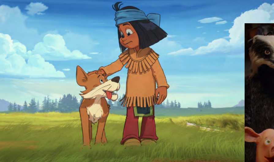
Yakari i wielka podróż