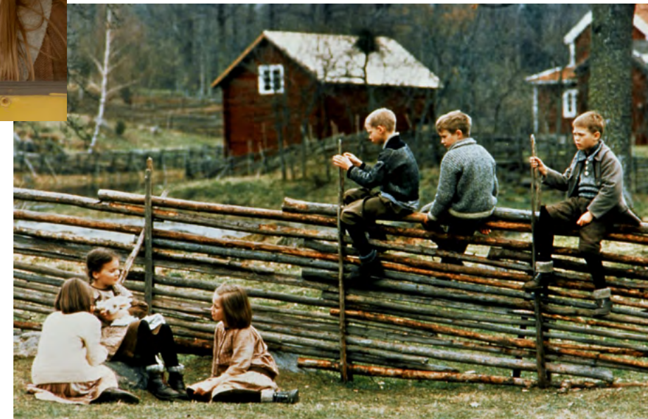
Nowe przygody dzieci z Bullerbyn