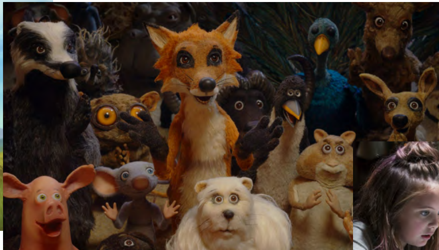
Nawet myszy idą do nieba