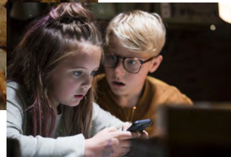
Biuro Detektywistyczne Lassego i Mai. Pierwsza tajemnica