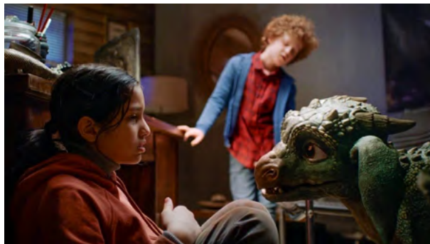
Jak ocalić smoka