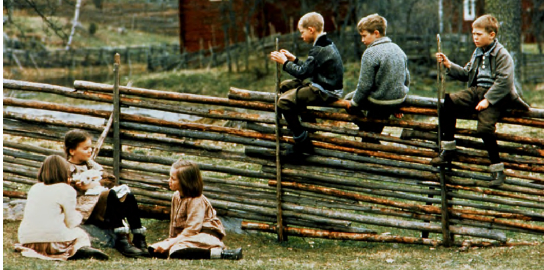
Nowe przygody dzieci z Bullerbyn