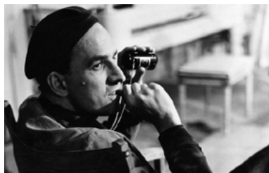
Bergman – rok z życia