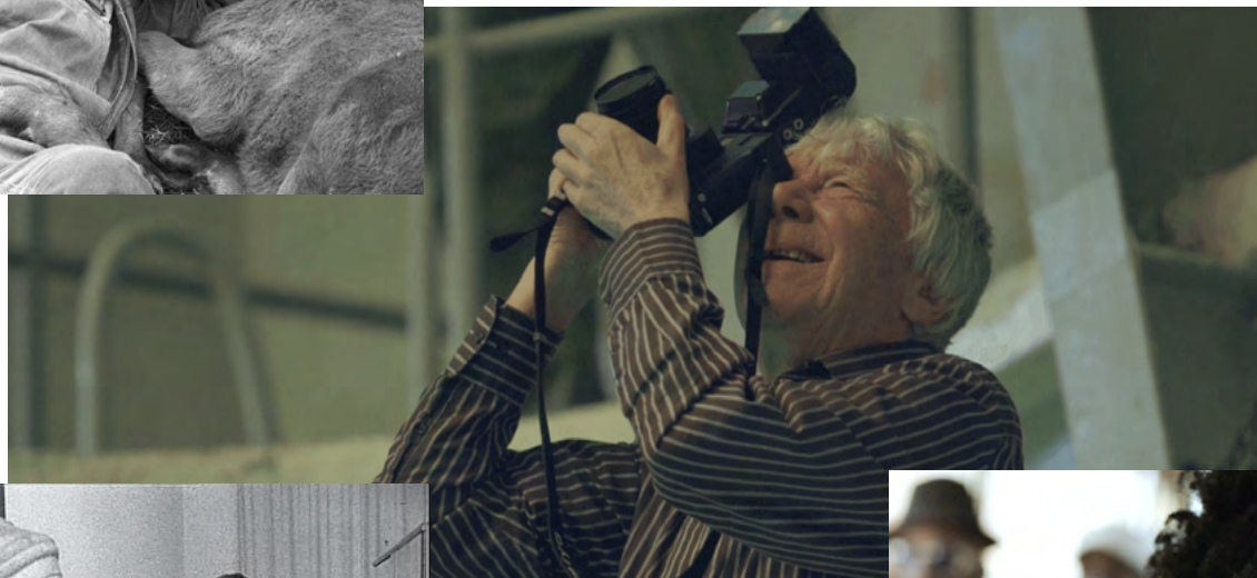
Nie jestem czarownicą