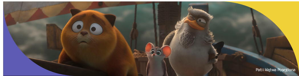
Pati i kłątwa Posejdonej

bilet wstępu 14 PLN; karnet 7 filmów 70 PLN